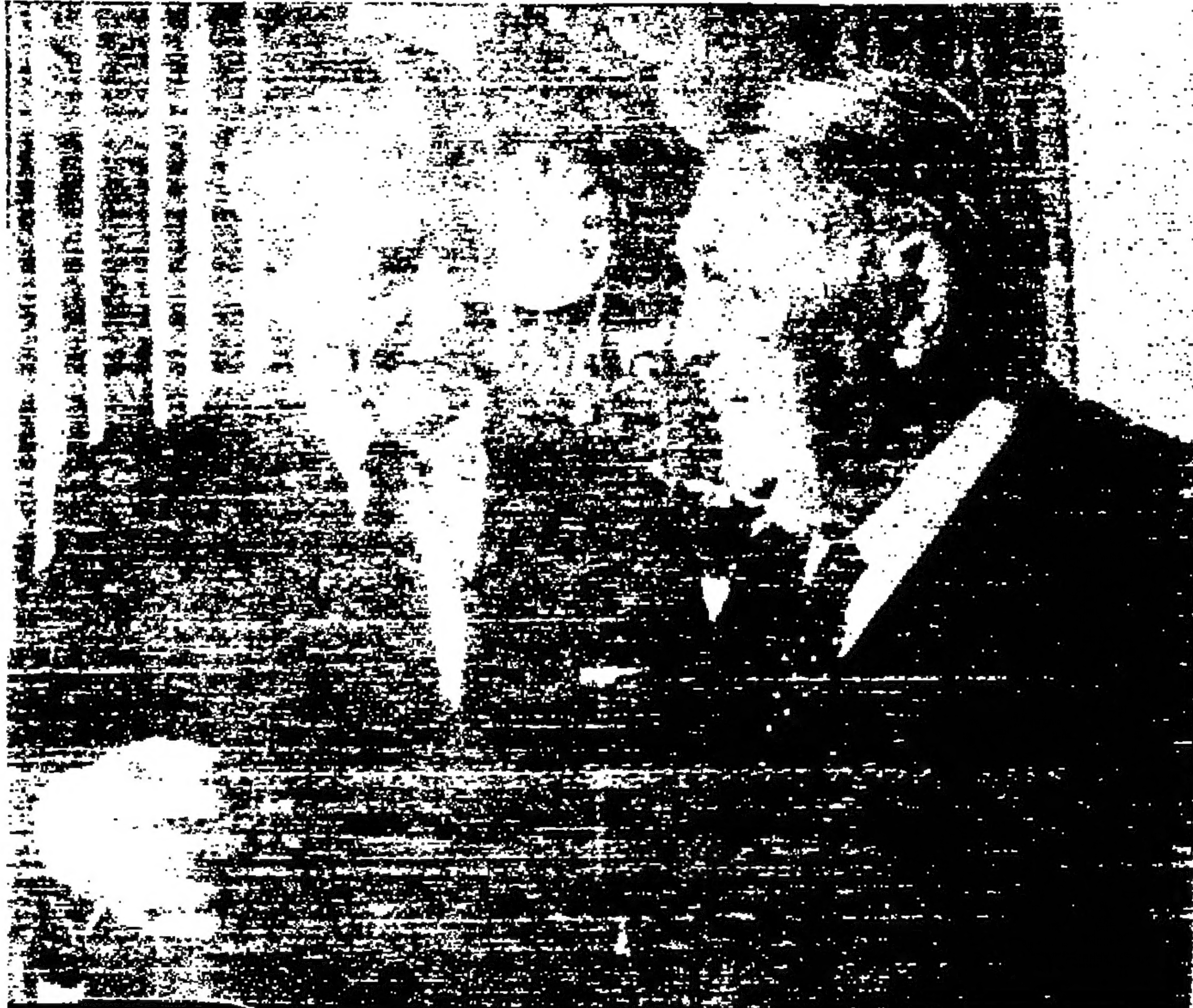
مستشار الاقليات كينسبرج (اليسار) يتشاور مع سلفه لودفيج ايرهارد بشأن أزمة القتل الدولية (صورة لاسمعية)